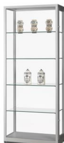
MERA 21 80x40x200cm

Ouverture par 2 portes sur charnière avec joint d'étanchéité (sur les côtés) avec 2 serrures par porte