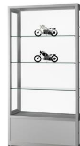
MERA 22A 100x40x200cm

Ouverture par 2 portes sur charnière avec joint d'étanchéité (sur les côtés) avec 2 serrures par porte