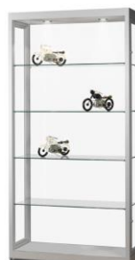
MERA 22 100x40x200cm

Ouverture par 2 portes sur charnière avec joint d'étanchéité (sur les côtés) avec 2 serrures par porte